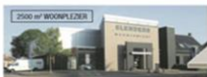
RIVERDALE inspiratie shop