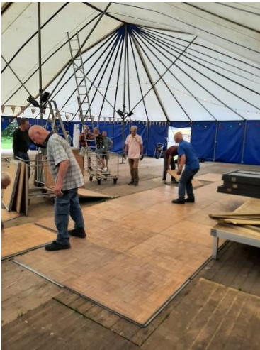
Gedanst zal er worden