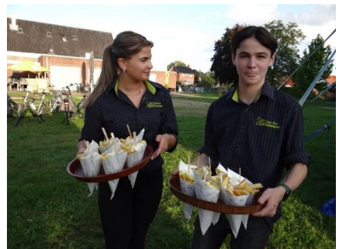
De tafels staan klaar