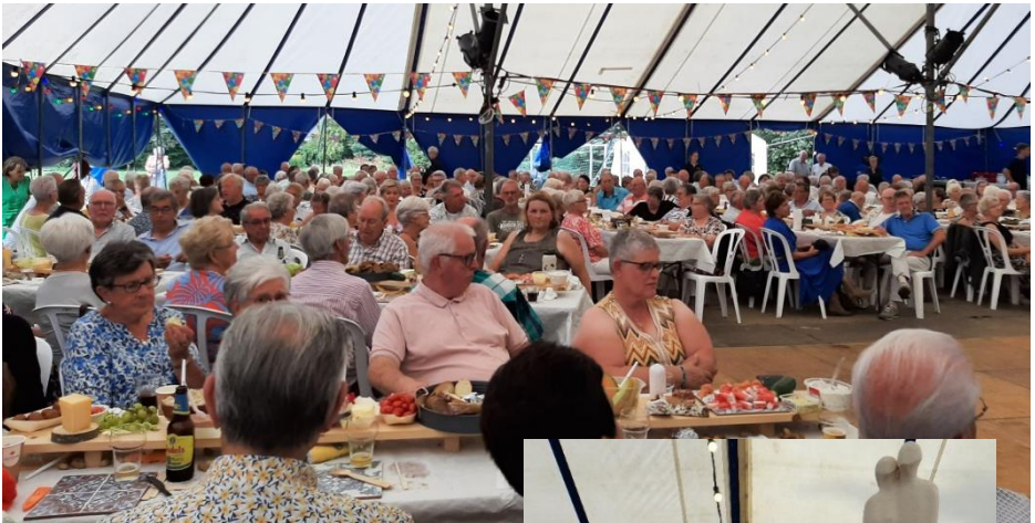
Er werd goed gegeten en gedronken